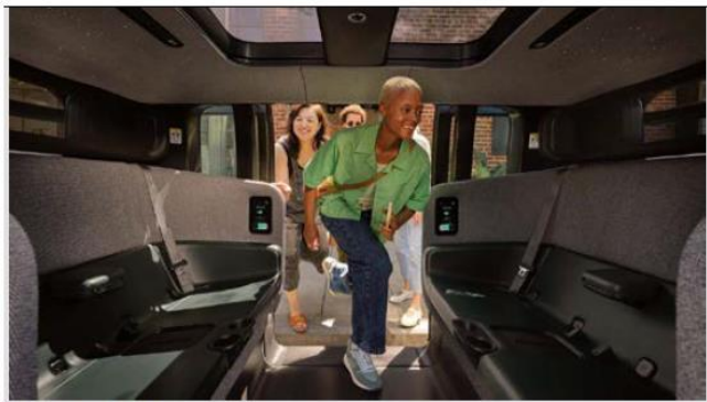
圖 10：Zoox 新一代自駕計程車