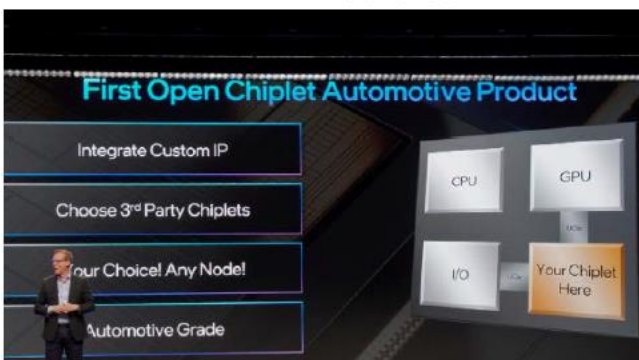
圖 2：Intel SDV SoC 透過 UClle 串聯第三方 IP