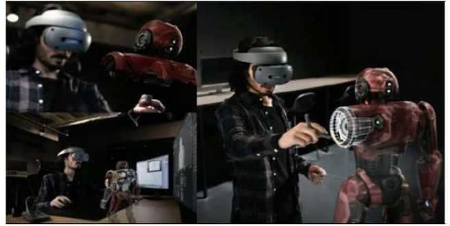
圖 8：Sony VR 頭盔應用場景