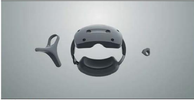
圖 7：Sony 新 VR 頭盔